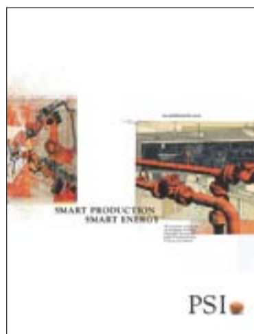
Der neue PSI-Geschäftsbericht 2007 (unter www.psi.de oder per E-Mail ir@psi.de anfordern)

Das Segment Energiemanagement wurde 2007 durch Investitionen belastet. Dadurch und durch den geringeren Fremdleistungsanteil verringerte sich der Umsatz auf 51,7 Millionen Euro. Das Be-