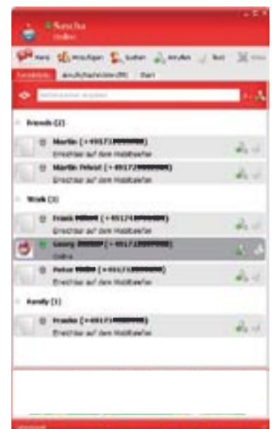
Vodafone Messenger PC

Der Dienstanbieter bietet mit PSImsr Mehrwertdienste bei vollständiger Kostenkontrolle an und hält die Kunden in seinem eigenen Netz. Er erhält wichtige Informationen über das Benutzerverhalten, und schafft neue