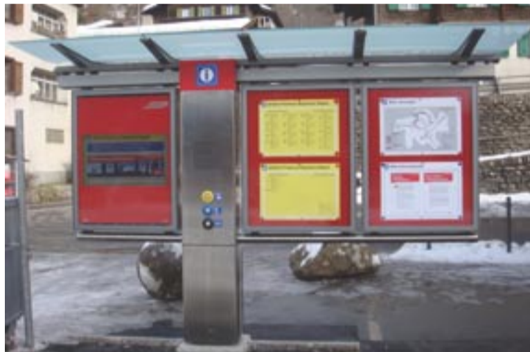
Kundeninformationsstele am Bahnhof Klosters Dorf

Die Software für die Steuerung des Kundeninformationssystems KIS basiert auf dem bereits in vielen Projekten erfolgreich eingesetzten Standardprodukt